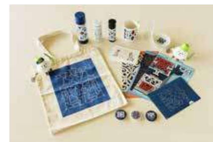
博物館 1F ミュージアムショップ

ウポポイ園内での自由時間などで、お土産の購入やご飲食利用ができる店舗があります。入場ゲート外の店舗ご利用でも再入場が可能です。