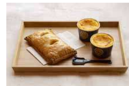
sweets café ななかまど イレンカ